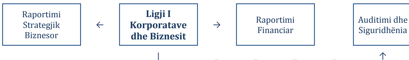
Diagrami.3.: Ndërlidhja e moduleve

Planprogrami i modulit Ligji i Korporatave dhe Biznesit, ka lidhje të drejtpërdrejta dhe të tërthorta midis moduleve të tjera dhe moduleve të mëparshme. Disa module janë të mbështetura drejtpërdrejt nga modulet e tjera dhe të tjerat kanë vetëm lidhje indirekte me njëra-tjetrën, siç janë lidhjet ekzistuese midis moduleve të kontabilitetit dhe auditimit.