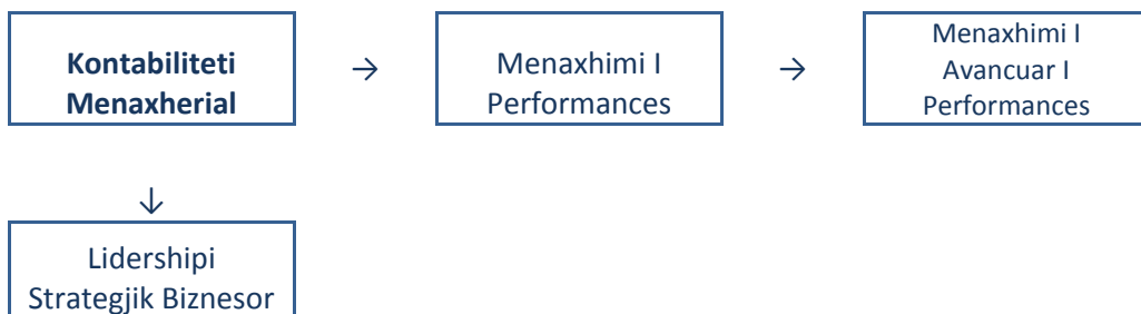
Diagrami.1.: Ndërlidhja e moduleve

Syllabusi për Librin FMA/F2, Kontabiliteti Menaxherial, i prezanton kandidatëve elementet e kontabilitetit menaxherial të cilat shfrytëzohen për marrjen dhe përkrahjen e vendimeve.