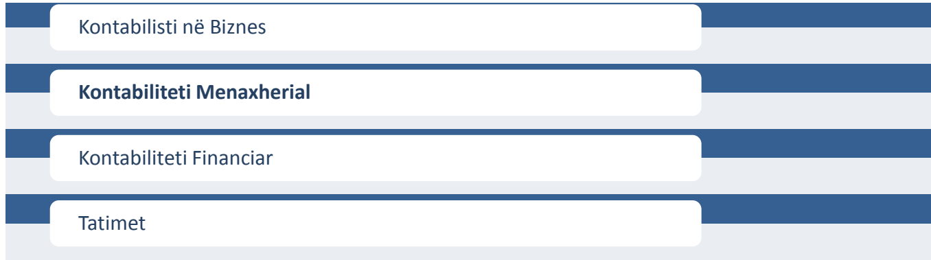
Diagrami.2.: Modulet e Kualifikimi Teknik Kontabiliteti

Kualifikimi Teknik Kontabiliteti përmbanë gjithsej katër module të cilat duhet të studiohen dhe të përfundojnë me sukses; me qëllim të fitimit të titullit.