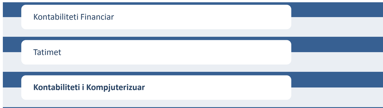
Diagrami.2.: Modulet e Kualifikimi Teknik Kontabiliteti

Kualifikimi Nëpunës Kontabiliteti i Avancuar përmbanë gjithsej katër module të cilat duhet të studiohen dhe të përfundojnë me sukses; me qëllim të fitimit të titullit.