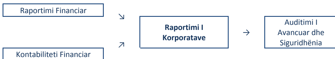
Diagrami.1.: Ndërlidhja e Moduleve

Plan programi për Provimin P2 Raportimi i Korporatave, kërkon njohuritë e përvetësuar në nivelin themelor përfshirë aftësitë kryesore teknike për përgatitjen dhe analizimin e raporteve financiare për njësi ekonomike të vetme dhe të kombinuara.