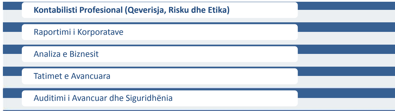
Diagrami.2.: Modulet e Kualifikimit Auditor i Jashtëm i Certifikuar

Kualifikimi Auditor i Jashtëm i Certifikuar përmbanë gjithsej pesë module të cilat duhet të studiohen dhe të përfundojnë me sukses; me qëllim të fitimit të titullit.