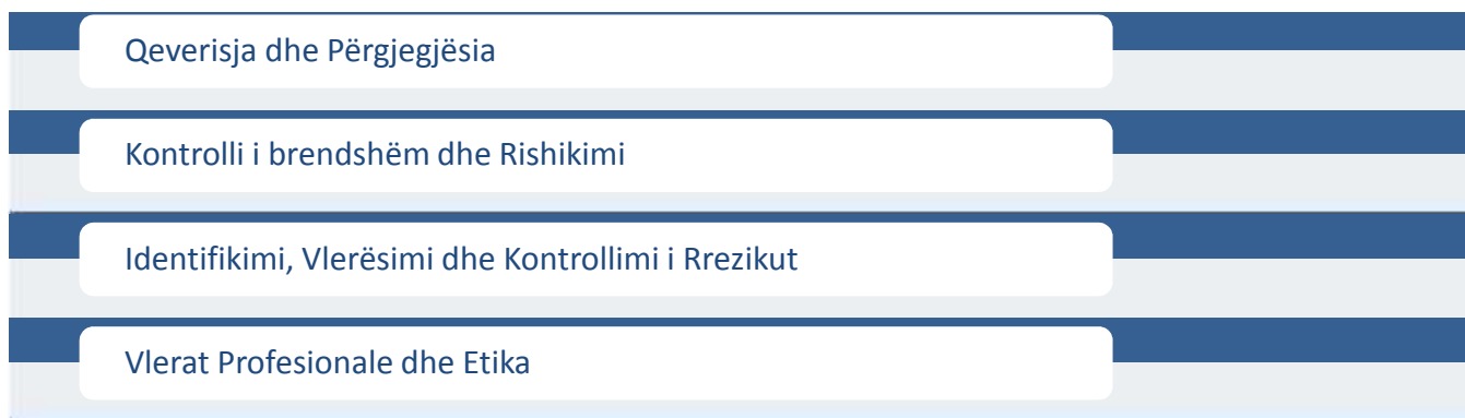
Diagrami.2.: Temat që do të trajtohen në Modulin Kontabilisti Profesional

Temat kryesore të Modulit Kontabilisti Profesional që do të trajtohen gjatë ligjerates: