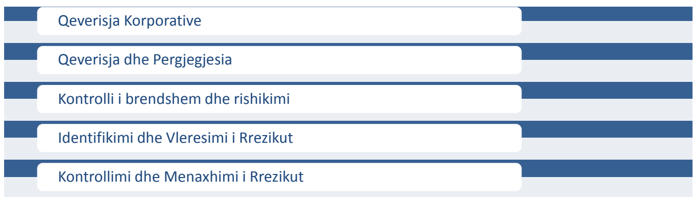
Diagrami.2.: Temat që do të trajtohen në Modulin Qeverisja e Korporatave

Temat kryesore të Modullit Qeverisja e Korporatave që do të trajtohen gjatë ligjërates: